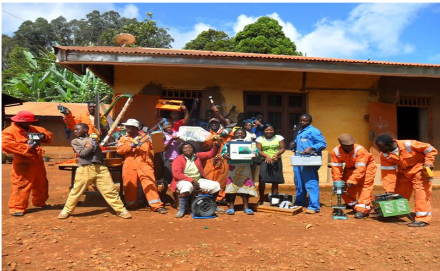
ook de meegestuurde overalls worden goed gebruikt door de Berikids

"Wij hopen dat het jullie goed gaat als deze brief jullie bereikt. We kunnen jullie melden dat we al het gereedschap bestemd voor de opleiding van de weeskinderen en kwetsbare personen in onze gemeenschap hebben ontvangen. Wij willen jullie heel hartelijk danken voor dit geweldige gebaar. Dit gereedschap zal het leven van de mensen waarvoor het is bedoeld ingrijpend veranderen en van grote invloed zijn op onze hele gemeenschap. Nogmaals bedankt!"